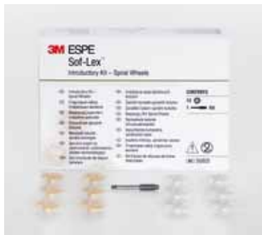
Sof-Lex™ Spiral Wheels – Tutvustuspakend